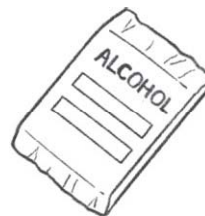
Alcohol Pad Alcool Pads